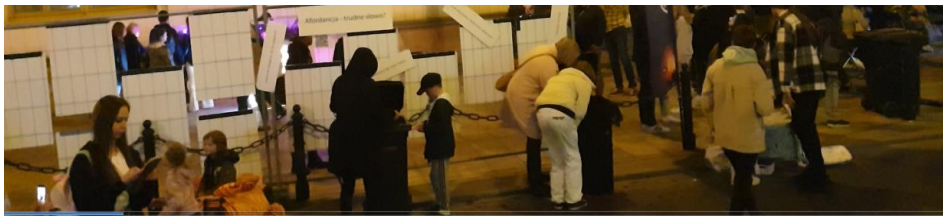
Ilustracja 4. Działanie Afordancje podczas Nocy Kultury