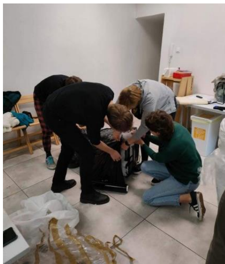
Ilustracja 3. Grupa studencka w działaniu: dokładanie tygrysowości i „bycia przytulnym” do śmietnika

Wykonaniem obiektów do działania Afordancje zajęła się przede wszystkim grupa studencka z Uniwersytetu Marii Curie-Skłodowskiej, wraz z przedstawicielkami Warsztatów Kultury w Lublinie. Studentki i studenci byli w dużej mierze zaznajomieni z tą koncepcją, niemniej tutaj chodziło o praktyczne zastosowanie i nieakademicką inwencję.