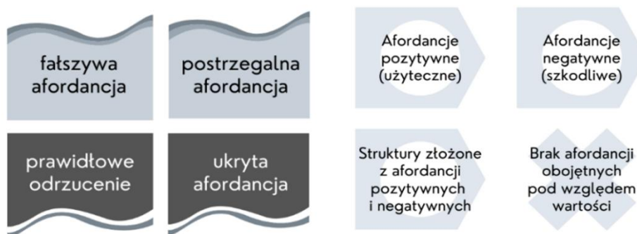
Ilustracja 1. Afordancje i nieafordancje w działaniu

Źródło: archiwum projektu (w ilustracji wykorzystano koncepcję Gavera [np. 1991] oraz Maiera i Fadela [np. 2009]).